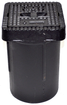
Strassenkappe / Cape de vanne Novo Gr. 4058 / UT CH / CF CH