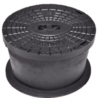
Strassenkappe / Cape de vanne Novo Gr. 4055 / 90