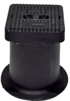
Strassenkappe / Cape de vanne Novo Gr. 4058-G